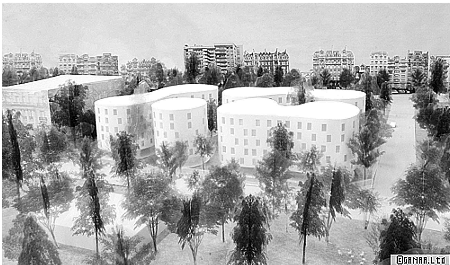
Vue du bois de Boulogne des 4 immeubles prévus avenue du Maréchal Fayolle

PARIS HABITAT ET LA MAIRIE DE PARIS DETRUISENT IMPUNEMENT DES ESPACES VERTS AFIN DE CONSTRUIRE DES BLOCS DE BETON COMME ON N'EN FAIT PLUS !!!